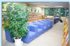
▲ブラウジングコーナー