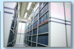
▲集密書架 (雑誌バックナンバー)