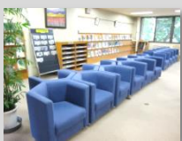
▲ブラウジングコーナー