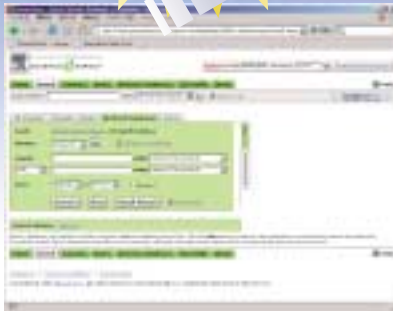
SDのプラットフォームから