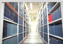
◀ 集密書架 (雑誌バックナンバー)