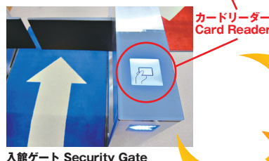
入館ゲート Security Gate